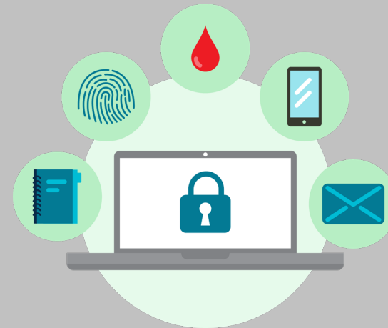
Behandling av helse- og personopplysninger